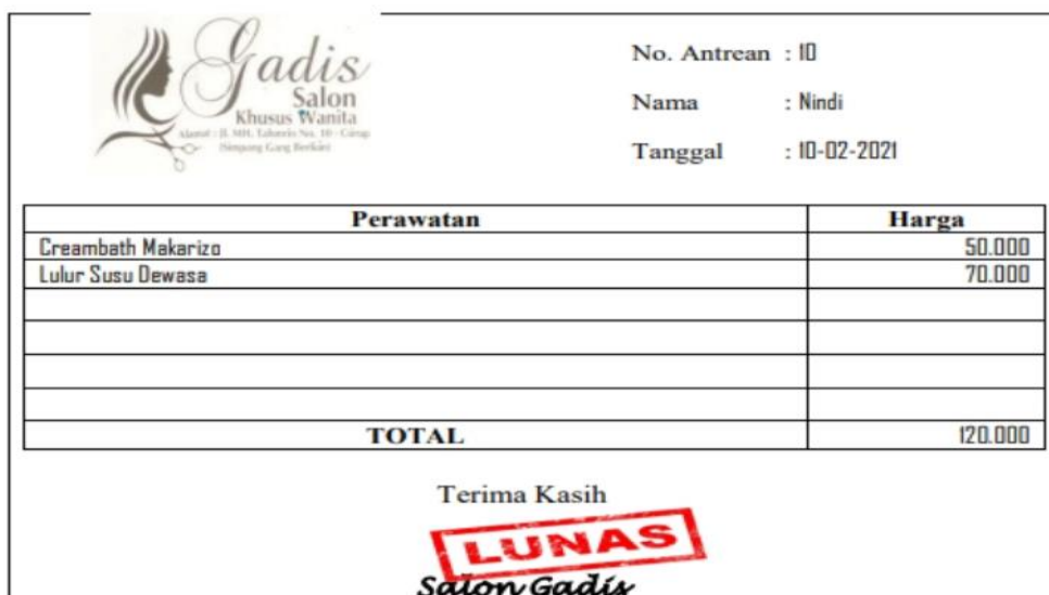
Gambar 5 Contoh Nota Lengkap

Karyawan mengisi kolom perawatan sesuai dengan perawatan yang baru saja dilakukannya kemudian karyawan memberikan nota tersebut ke meja kasir. Setelah itu pelanggan melakukan pembayaran dimana seharusnya pembayaran dilakukan satu pintu yaitu di kasir, bukan ke karyawan yang melayani pelanggan tersebut. Fungsi kas atau kasir berperan mengisi jumlah harga perawatan serta memberikan cap lunas di nota yang sudah diberikan karyawan