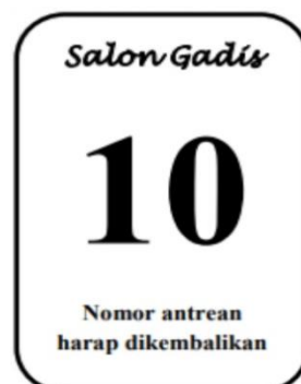
Gambar 3. Contoh nomor antrian

Setelah pelanggan mendapatkan nomor antrean, pelanggan dipersilahkan duduk di kursi tunggu hingga nomor antrean yang bersangkutan dipanggil. Saat nomor antrean yang bersangkutan dipanggil, karyawan sebagai fungsi pelayanan mengarahkan pelanggan ke kursi pelayanan serta menyiapkan alat dan bahan yang diperlukan sesuai perawatan yang diminta pelanggan lalu karyawan memulai proses pelayanan. Sebagai bukti proses pelayanan