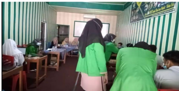
Gambar 6. Suasana Penyampaian Materi