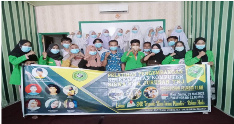
Gambar 7. Photo Bersama Pemateri dan Kepala Sekolah

Dari Jumlah peserta pelatihan sebanyak 12 peserta yang mengikuti pelatihan didapatkan hasil jawaban responden yang sudah diolahkan menjadi Diagram Tabelnya sebagai berikut :