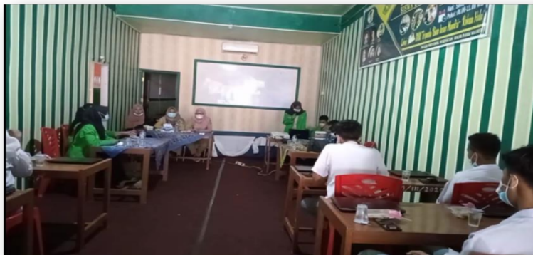
Gambar 5. Suasana Peserta Pelatihan Di ruangan

Permasalahan yang ditemukan di Sekolah Menengah Kejuruan Terpadu Bina Insan Mandiri adalah kurangnya praktikum sehingga pemahaman materi tidak banyak didapat. Untuk menambah pengetahuan dan wawasan bagi siswa jurusan teknik komputer dan jaringan, maka diberikan solusi untuk memberikan materi pembelajaran dan praktikum langsung.