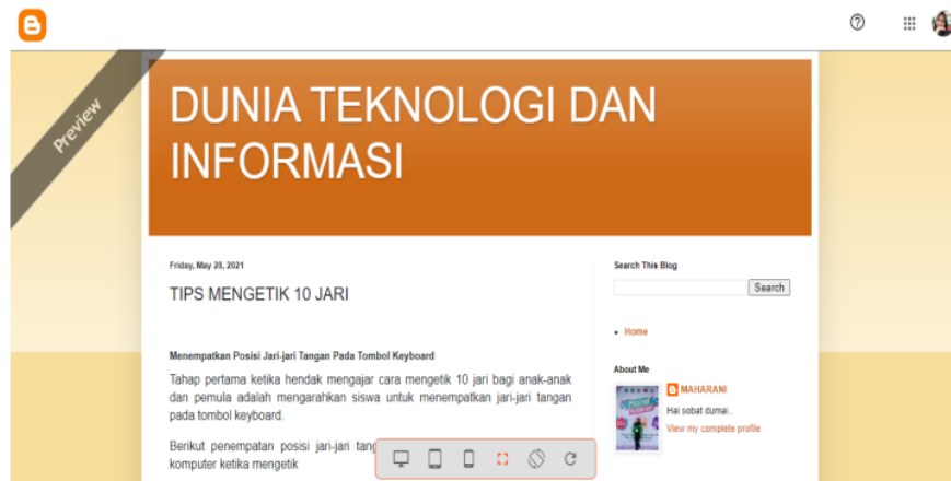
Gambar 1. Tampilan blog