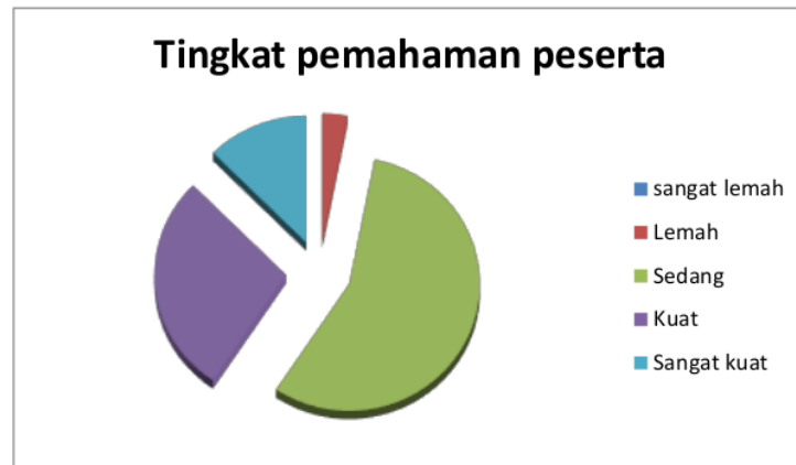
Gambar 8. Hasil Tingkat Pemahaman