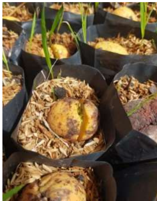
Gambar 2. Ukuran petakan 6m x 1.10 m dapat memuat 1500 bibit dalam polibag ukuran 12cm x 17cm.

Mitra juga dapat melihat langsung proses pembibitan permanen BPDAS Ketahun di TAHURA (Gambar 3). Setelah kembali dari kunjungan ke Tahura, mitra kami berikan materi sosialisasi terkait tahapan-tahapan program PPM skema IPTEKS (Gambar 4).