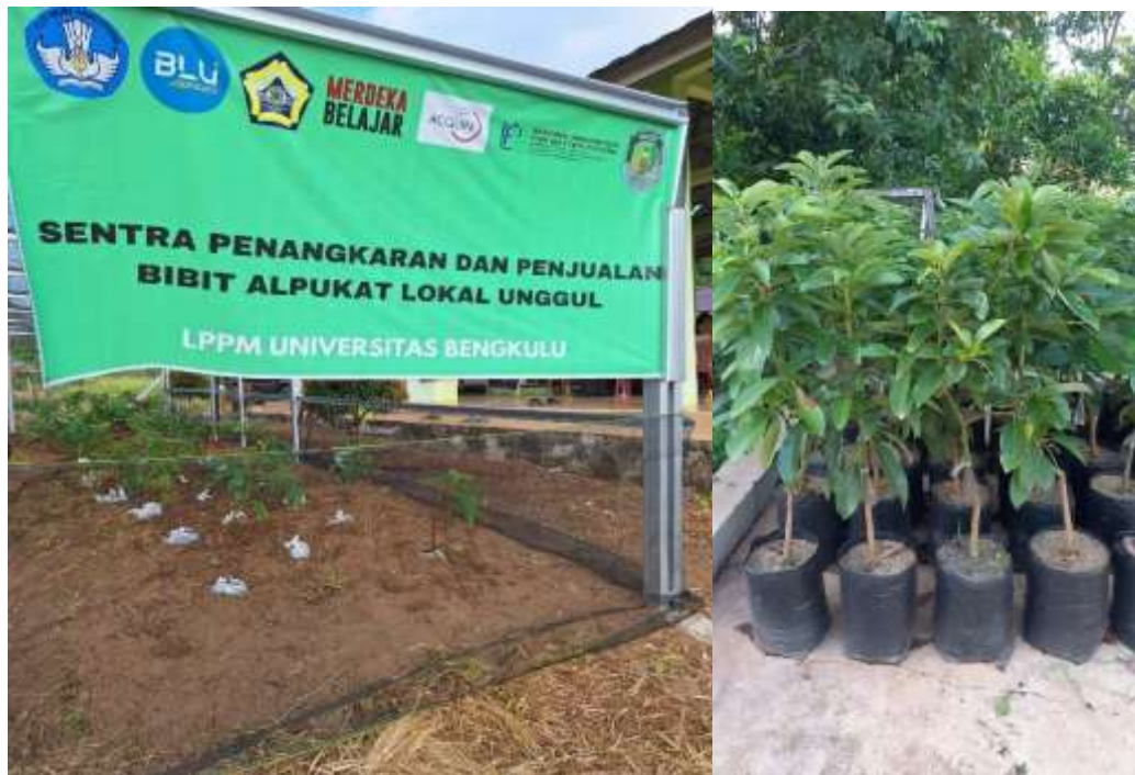
Gambar 7. Display bibit alpukat sambung pucuk siap jual di lingkungan Glamping.

Evaluasi telah dilakukan terhadap mitra, sebelum kegiatan PPM skema IPTEK ini (Gambar 6). Ada 6 pertanyaan yang sama diajukan sebelum dan sesudah kegiatan. Sebelum kegiatan diketahui bahwa sebagian besar mitra belum mengetahui cara pembibitan alpukat, memilih benih yang baik, dan pemeliharaan benih. Hal ini wajar terjadi karena sebagian besar mitra memang belum pernah melakukan pembibitan alpukat. Teknik sambung pucuk alpukat belum dikenal dengan baik. Sehingga dengan sosialisasi, mitra sangat antusias ingin segera mencoba melakukan perbanyak tanaman alpukat dengan cara sambung pucuk di lingkungan Glamping ini.