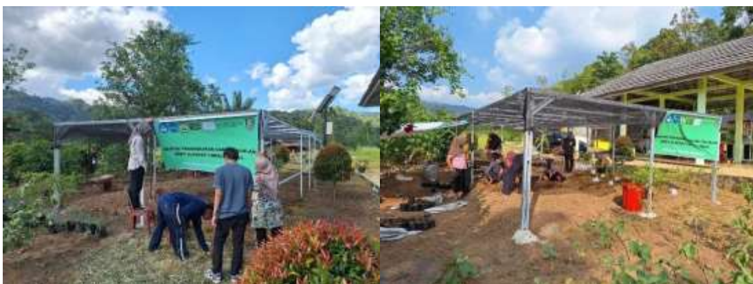
Gambar 6. Pendekatan melalui praktek membuat pembibitan permanen di lingkungan Glamping.