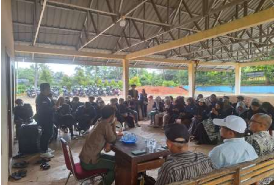
Gambar 1. Kunjungan ke pembibitan permanen TAHURA (penjelasan sebelum terjun keliling lahan)