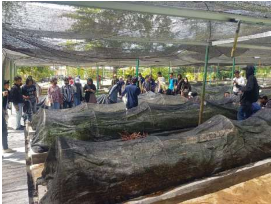
Gambar 3. Melihat langsung instalasi pembibitan permanen alpukat di Tahura.