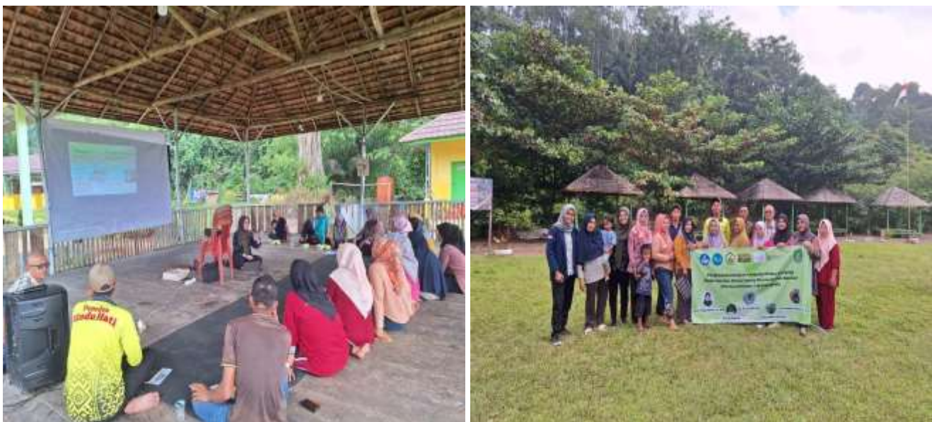
Gambar 4. Sosialisasi melalui penyuluhan untuk memberikan informasi kepada masyarakat pentingnya penghijauan dan menjaga plasma nutfah alpukat serta pengembangannya dengan cara pembibitan menggunakan IPTEK teknik sambung pucuk.