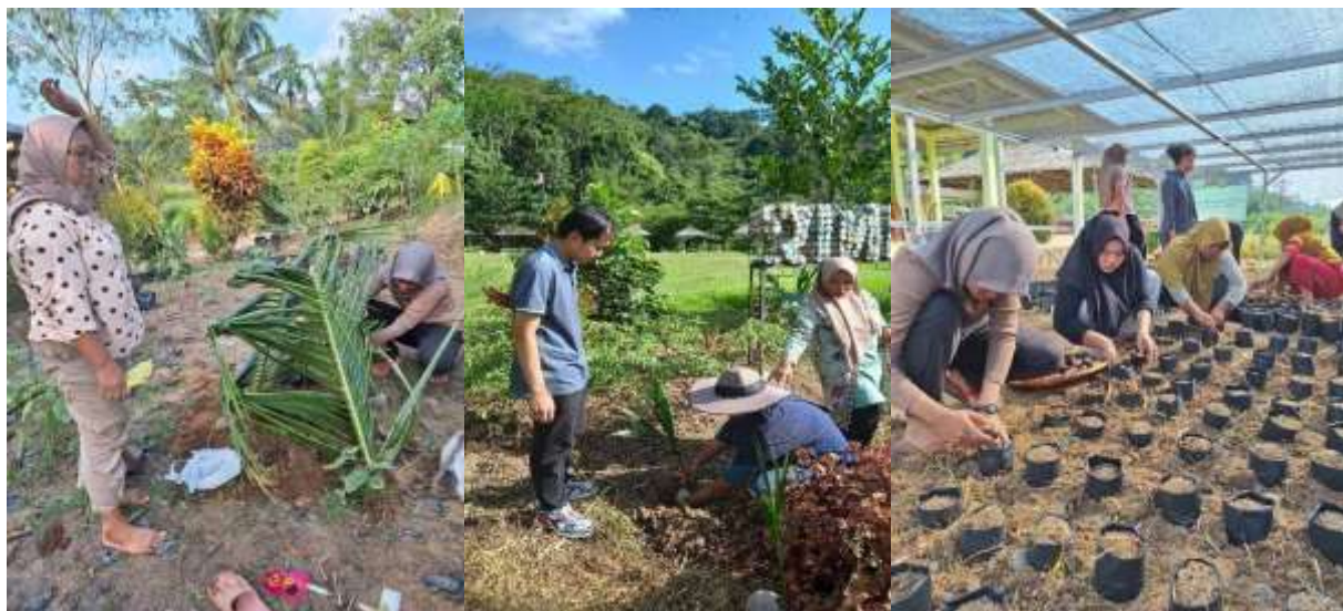
Gambar 5. Pendekatan melalui praktek penghijauan dan persemaian batang bawah alpukat.

Setelah mendapatkan materi sosialisasi, dilakukanlah demonstrasi atau praktel lapangan. Calon pohon induk alpukat ditanam disekitar lingkungan pembibitan permanen. Bibit kelapa hijau juga ditanam sebagai tanaman campuran di antara baris pohon induk alpukat. Hal ini dimaksudkan agar sekaligus dapat menjadi tanaman naungan dan sumber plasmanutfah tanaman lainnya. Biji rootstock ditanam di bedeng-bedeng pembibitan permanen yang disusun sedemikian rupa (Gambar 5). Pembibitan permanen diberi papan nama agar mudah terlihat oleh pengunjung Glamping (Gambar 6). Pada sisi lain dalam pembibitan permanen, di sediakan space untuk display bibit alpukat yang siap distribusi (Gambar 7). Pengunjung Glamping dapat membeli bibit alpukat lokal ini sebagai suvenir untuk di tanam di rumahnya.