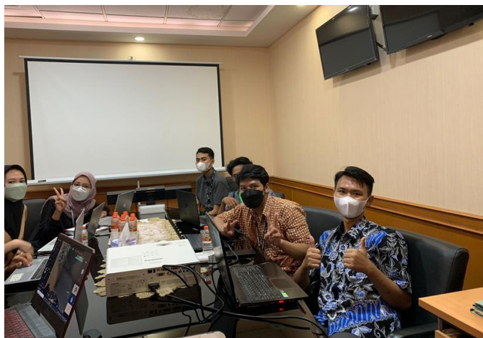
Gambar 2. Rapat Penentuan Tema Rancangan Sistem Satu Data

Keempat, Keahlian khusus yang berhasil penulis kembangkan ialah mampu mengoperasikan aplikasi perangkat lunak yang digunakan dalam aktivitas bisnis untuk kepentingan input data, proses data, serta visualisasi dan pemaparan data untuk kepentingan dashboard.