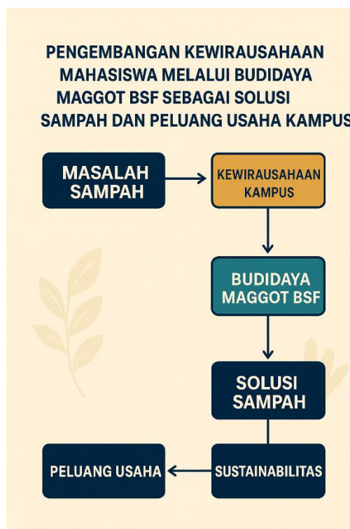
Gambar 1. Alur Pelaksanaan Pengabdian

Kegiatan ini menggunakan metode penyuluhan, pembimbingan dan demonstrasi dan pelatihan seperti teknik pemeliharaan, pembuatan media tumbuh maggot, teknik pemanenan dan teknik pembuatan pupuk organik dengan bantuan dekomposer larva Hermetia illucens .