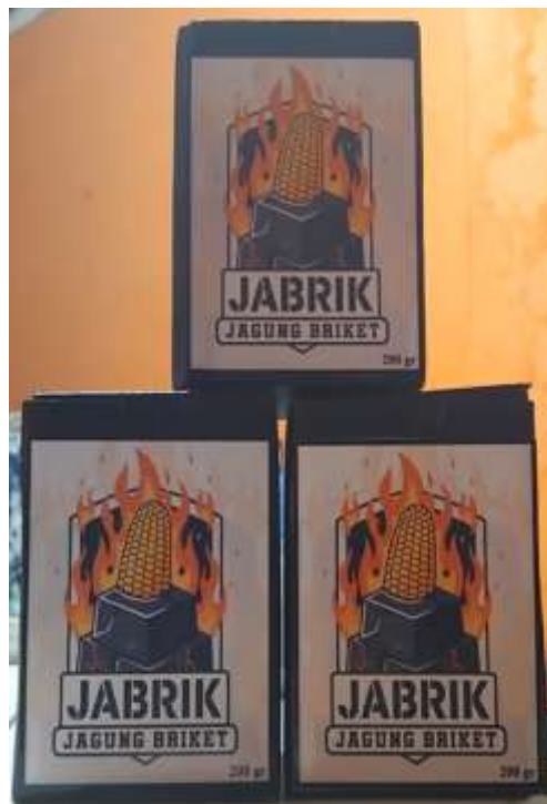
Gambar 6. Produk Jagung Briket

Desain kemasan juga dibuat informatif dengan menambahkan logo, nama produk, dan keterangan singkat mengenai manfaat serta cara penggunaan briket. Melalui kegiatan ini, produk briket jagung hasil olahan masyarakat Desa Pagar Kaya memiliki citra yang lebih profesional dan mudah dikenali oleh konsumen, sehingga meningkatkan daya saing dan nilai ekonominya.