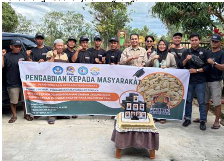
Gambar 5 Pendampingan

Melalui pelatihan dan pendampingan ini, kelompok tani Desa Pagar Kaya kini mampu mengolah bonggol jagung menjadi briket ramah lingkungan secara mandiri. Kegiatan ini tidak hanya mengurangi limbah pertanian, tetapi juga menghasilkan produk energi alternatif yang bernilai ekonomi dan mendukung keberlanjutan lingkungan.