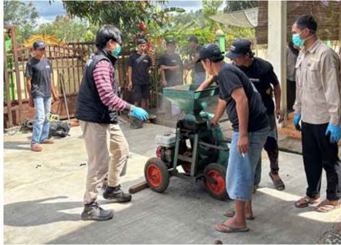
Gambar 4 Proses Penghancuran Bonggol menjadi Serbuk

Pada aspek pengolahan bonggol jagung, kegiatan difokuskan pada pemanfaatan limbah pertanian yang selama ini belum dimanfaatkan secara optimal. Bonggol jagung yang sebelumnya dianggap sebagai limbah, dikumpulkan dari lahan pertanian milik anggota kelompok tani. Selanjutnya dilakukan proses pengeringan untuk mengurangi kadar air, agar mudah dihancurkan dan menghasilkan serbuk halus sebagai bahan dasar pembuatan briket.