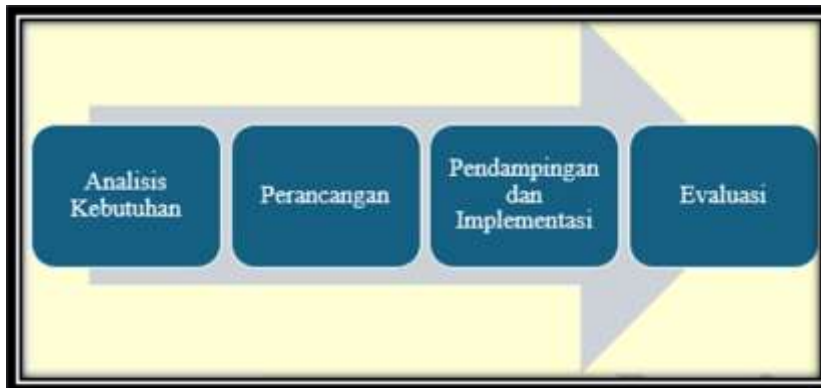
Gambar 3 Metode Pelaksanaan PkM

Metode yang digunakan dalam kegiatan pengabdian kepada masyarakat ini melalui sebagai berikut :