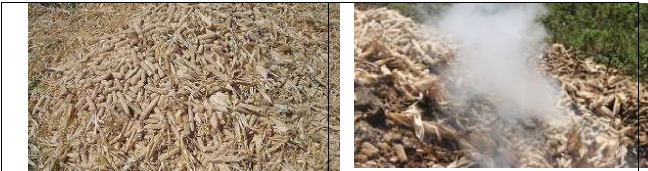
Gambar 2 Limbah dari Jagung

Kelompok tani Nakau Jaya yang memiliki anggota 20 petani, merupakan kelompok petani yang beralamat di desa pagar kaya kecamatan sukamerindu kabupaten Lahat yang telah berkecimpung dalam budidaya tanaman jagung. Hasil observasi dan wawancara awal dengan kelompok tani, ditemukan bahwa yang sering dihadapi petani adalah bertumpuknya limbah bonggol jagung saat setelah panen raya. Penumpukan bonggol (Irmawati, 2020) jagung yang tidak dimanfaatkan dan dibuang atau dibakar dapat menjadi pencemaran lingkungan (Wahyudi et al., 2022).