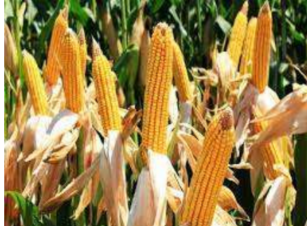
Gambar 1 Tanaman Jagung

2019). Kebutuhan pasar akan jagung masih terus meningkat dan harga yang tinggi merupakan faktor yang merangsang petani untuk terus membudidayakan tanaman jagung (Siregar et al., 2023). Sumatera Selatan menjadi salah satu pemasok jagung tersebar di Indonesia, salah satu wilayahnya yaitu Kabupaten Lahat.